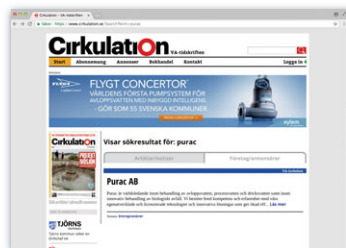
Sökbar på Cirkulations webb